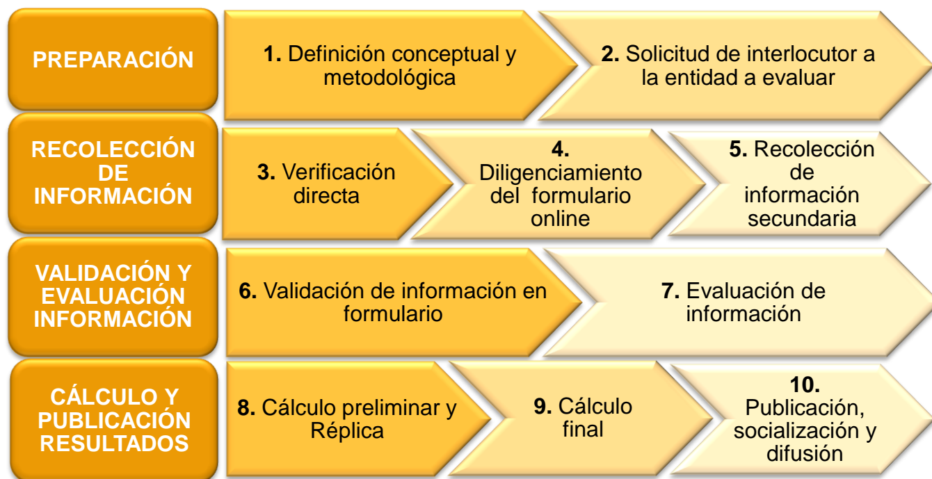
GRÁFICA 1. RUTA METODOLÓGICA

Los pasos 1 y 2 hacen parte de la preparación del Índice en cuanto a su construcción conceptual y metodológica, además de la primera interlocución directa con las entidades a evaluar. Posteriormente, los pasos 3, 4, y 5 conforman la fase de recolección de la información necesaria para aplicar los indicadores y subindicadores de evaluación, a partir de diferentes fuentes cuya descripción se ampliará más adelante. A su vez, esta información es revisada y analizada a través de un proceso de validación y otro de evaluación (pasos 6 y 7). Finalmente, los análisis y respuestas obtenidas en las fases anteriores se traducen en resultados cuantitativos que se publican y difunden a las entidades evaluadas y a la ciudadanía en general (pasos 8, 9, 10).