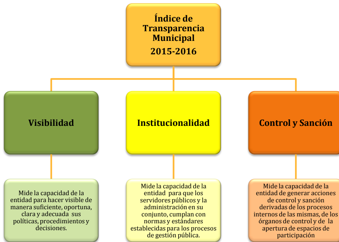
Gráfica 2. Factores de evaluación

Dichos factores, y los indicadores de evaluación que de ellos se derivan, contienen ponderadores o pesos diferenciados para el cálculo de la calificación final del Índice. Estas ponderaciones se asignan por libre consideración metodológica y conceptual, de acuerdo con la importancia que se otorga a cada factor e indicador. Específicamente, los criterios utilizados para la asignación de ponderaciones son: