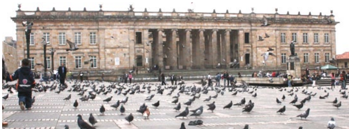
Prensa Senado de la República

Luego del importante papel que jugó la Alianza Más Información Más Derechos , de la cual Transparencia por Colombia hace parte, en la formulación del proyecto de la Ley de Acceso a la Información Pública, el 20 de julio de 2012 fue aprobada la norma por el Congreso de la República. Sin duda, la aprobación del proyecto constituye un resultado positivo para el país,