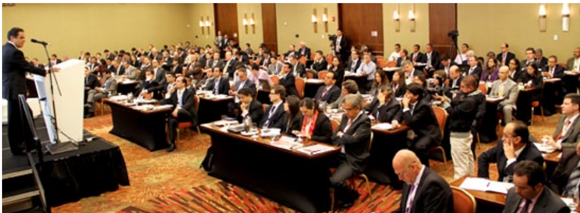
Andean Infrastructure Summit.

El Índice de Transparencia Nacional, Departamental y Municipal sigue siendo una de las herramientas más utilizadas por las autoridades públicas para monitorear y mejorar sus apuestas institucionales en torno a la transparencia y la anticorrupción. El 2012 fue un nuevo año de revisión de resultados con las entidades y capacitación a los servidores públicos en las temáticas que evalúa el instrumento.