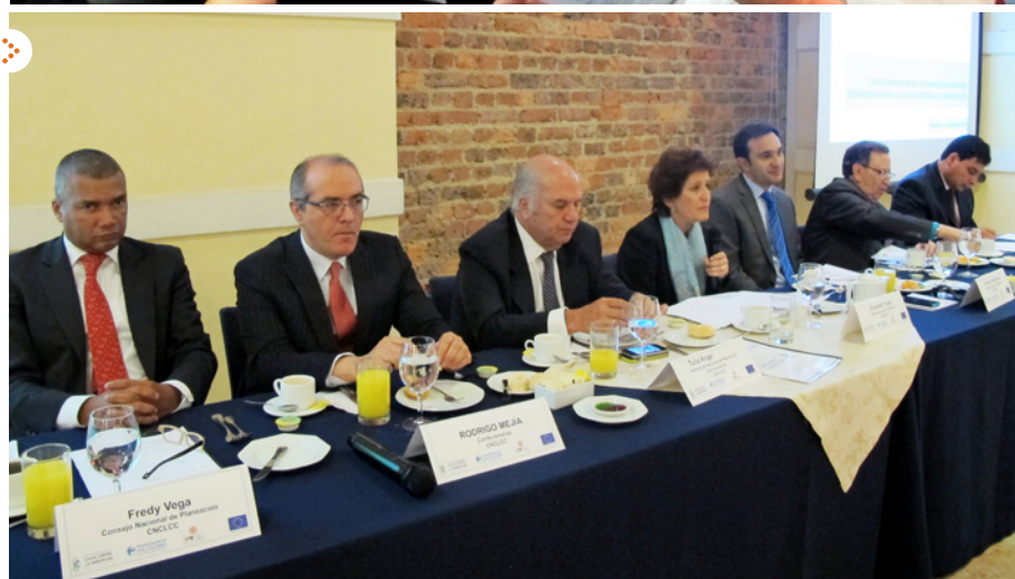
Entrega del Tercer Informe de la Comisión Nacional Ciudadana para la Lucha contra la Corrupción.