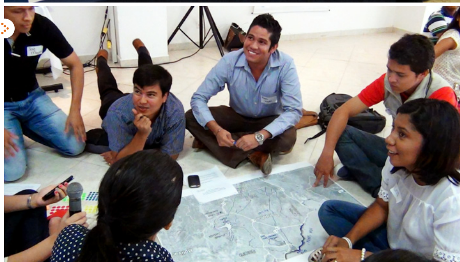
Taller de Transparencia en las Industrias Extractivas.