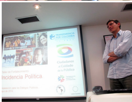
Conferencia - Taller sobre la Ley de Acceso a la Información Pública "Retos y Perspectivas", en Bogotá y Bucaramanga.