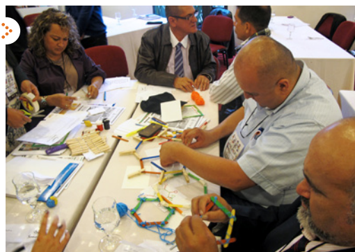
Ejercicios de control social en el seguimiento a proyectos de salud, agua y saneamiento básico.