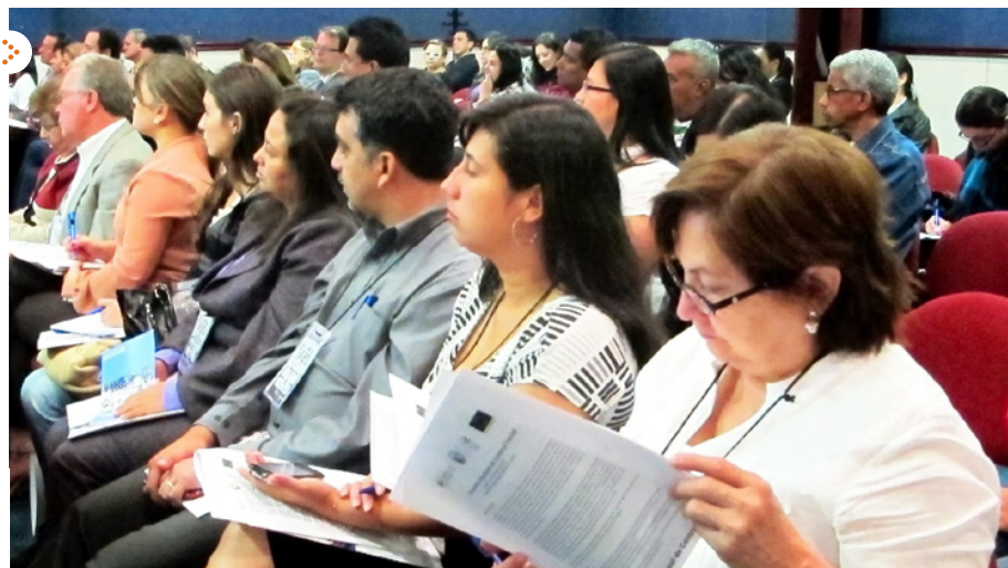
Tercera Fase 'Fondo de Control Social Ciudadanos al Servicio de lo Público'.