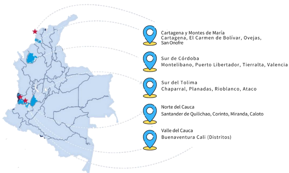
Mapa 1. Ciudades y municipios en los que se implementaron las 18 ACA