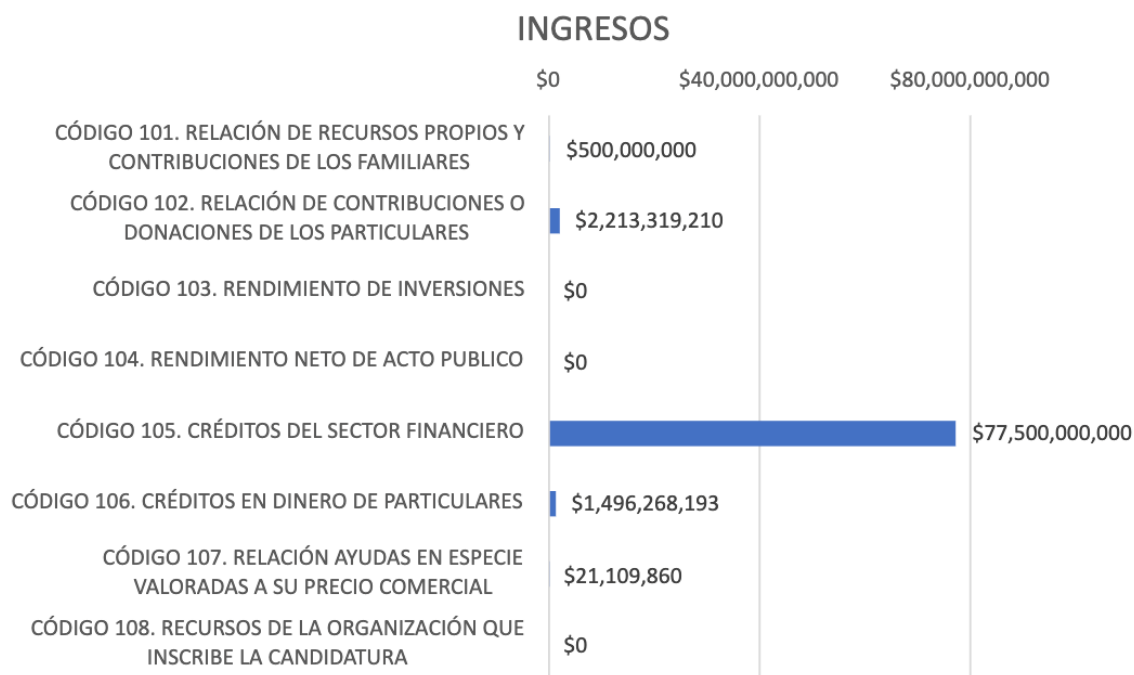
Gráfica 1. Total de ingresos por código de las 9 campañas que reportan en Cuentas Claras