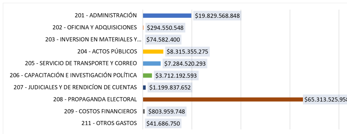
Gráfica 2. Total de gastos por código