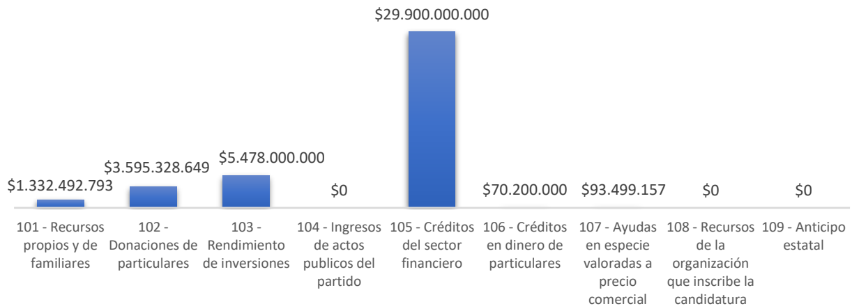
Gráfica 2 Ingresos reportados por los candidatos a la Presidencia 2022-2025.

Fuente: Elaboración propia a partir de los datos reportados en Cuentas Claras