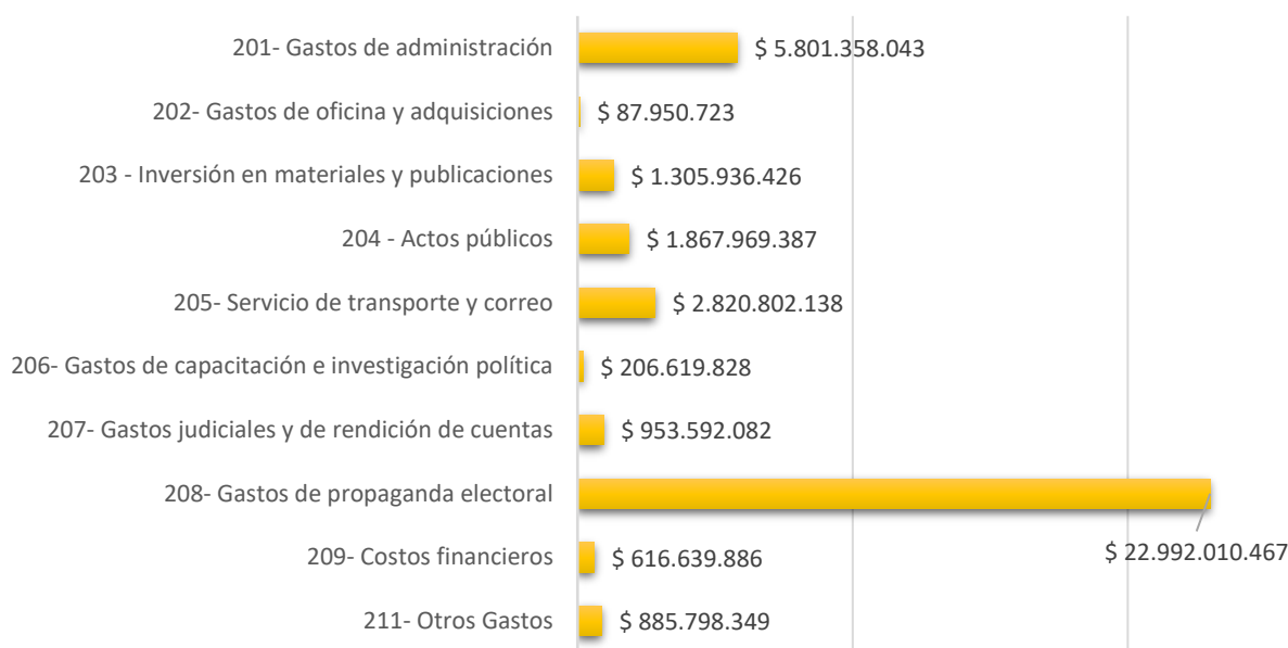
Gráfica 6. Gastos de los candidatos a las consultas interpartidista