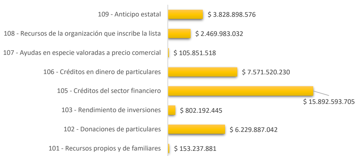
Gráfica 5. Fuentes de ingresos de los candidatos a las consultas interpartidistas