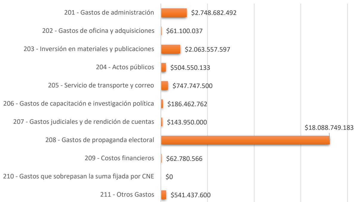
Gráfica 3. Gastos reportados por los candidatos a la Presidencia 2022-2025.

Fuente: Elaboración propia a partir de los datos reportados en Cuentas Claras